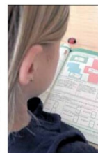
Evaluering er fint. Men de nationale test gives ikke mening flertallet af politikerne.

af test. Så lad os vente på det udspil, sagde han. Jeppe Jakobsen (DF) kunne heller ikke se, at de nationale test kunne lægge det helt store pres på eleverne. I et helt skoleforløb er der kun 10 obligatoriske test. Og det er farligt, hvis man ikke bliver evalueret. At afskaffe dem helt vil være ærgerligt, for der findes altså lærere, som synes, det er et godt redskab. De tør bare ikke sige det højt, sagde han. Rasmus Brandstrup (V) bemærkede, at kommunen ikke har spurgt skolerne. Hvorfor har man ikke