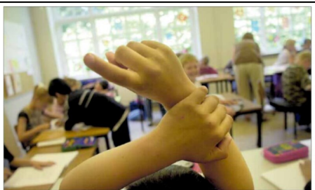
Eleverne i Holbæk Kommunes folkeskoler skal ikke igennem en ny strukturændring. Til gengæld vil de opleve nogle mindre forandringer i hverdagen. For eksempel kommer der en daglig leder på alle afdelinger. Ispisemøderne skal have nye rumme.

på baggrund af den evaluering, der er lavet af strukturen. Anbefalingerne indeholder fire indkomster og justeringer, men selv strukturen bevares. Det lå kortere, at der politisk ville være opbakning til anbefalingerne, som blandt vil medføre, at der fremover skal være en daglig leder på hver skoleafdeling og hvert børnehavn. Men opbakningen viste sig ikke at være nær så stor som forventet. For kan Socialdemokratiet, Dansk Folkeparti, Lokallisten, Enhedslisten og SF stemte for: